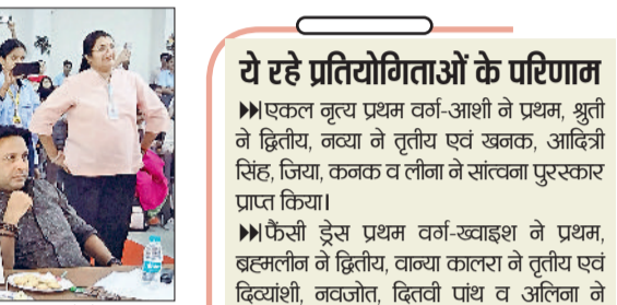
रेवाड़ी। कार्यक्रम में मौजूद निर्णायक मंडल, शिक्षक व अभिभावक।