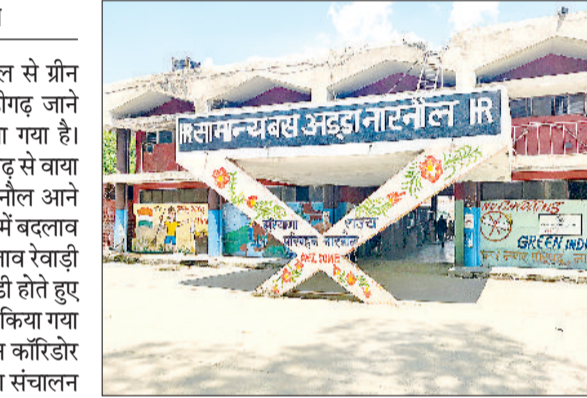
नारनौल। बस स्टैंड परिसर।

नारनौल से चंडीगढ़ जाने वाली बसों की समय सारणी