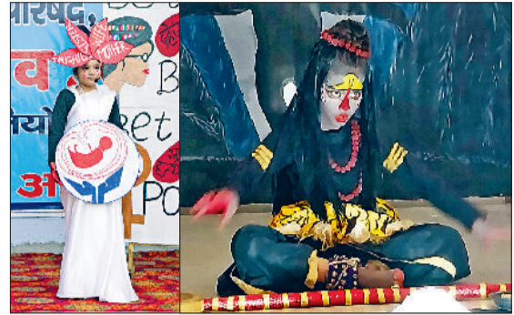
रेवाड़ी। बाल महोत्सव कार्यक्रम का शुभारंभ करते बच्चे व अधिकारी व फैसी ड्रेस प्रतियोगिता में भाग लेती छात्रा व सोलो डांस में भाग लेते हुए प्रतिभागी।