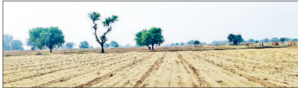
रेवाड़ी। सरसों की बिजाई के लिए तैयार किया गया एक खेत।

निकलती है। दोपहर तक गर्मी का प्रभाव बढ़ जाता है, जिससे लोगों को कूलर तक चलाने पड़ते हैं। मंगलवार को सुबह से ही आसमान साफ रहा। अधिकतम तापमान 32.5 डिग्री सेल्सियस पर स्थिर रहा। रात का तापमान 1.0 डिग्री सेल्सियस गिरकर 12.5 डिग्री पर आ गया। गत वर्ष 14 अक्टूबर को रात का तापमान