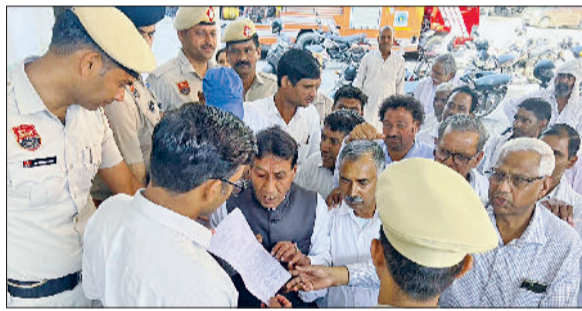
रेवाड़ी। कोसली में एसडीएम को ज्ञापन देते विभिन्न संगठनों के कार्यकर्ता।