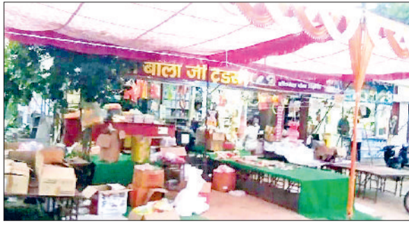
महेंद्रगढ़। दीपावली के लिए सजा बाजार।

वहीं अब दीपावली पर्व को लेकर बाजार में भी चलन-पहल बढ़ गई है। महिलाओं ने घर के कोनों-कोनों की सफाई में जुटना