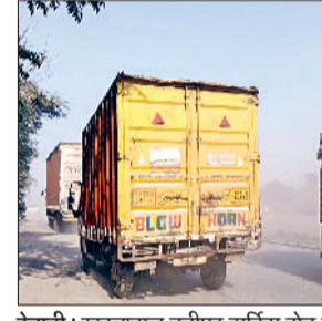
रेवाड़ी। खस्ताहाल बनीपुर सर्विस रोड से गुजरते वाहन।

दीवाली पर्व पर नेशनल हाइवे पर वाहनों का दबाव काफी बढ़ जाता है। वाहनों की संख्या अधिक होने के कारण वैसे ही यह राजमार्ग काफी बिजरी रहता है। बनीपुर चौक पर दीवाली के आसपास वाहनों की संख्या बढ़ने से हालात बंद से बदतर हो सकते हैं। इस चौक पर वाहन फंसने के बाद जाम राजस्थान बॉर्डर तक पहुंच जाता है, जिससे हजारों वाहन चालकों को भारी परेशानी का सामना करना पड़ता है। महज दो किलोमीटर की दूरी तय करने में ही वाहन चालकों को दो से तीन घंटे का समय लग जाता है।