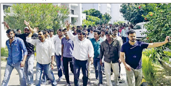
रेवाड़ी। मांगों को लेकर आईजीयू में प्रदर्शन करते हुए विद्यार्थी।