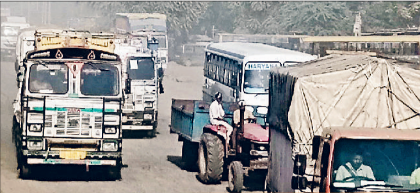
दिल्ली-जयपुर नेशनल हाइवे पर बड़ा ट्रैफिक का दबाव

महज दो किलोमीटर की दूरी तय करने में ही वाहन चालकों को दो से तीन घंटे का समय लग जाता है।