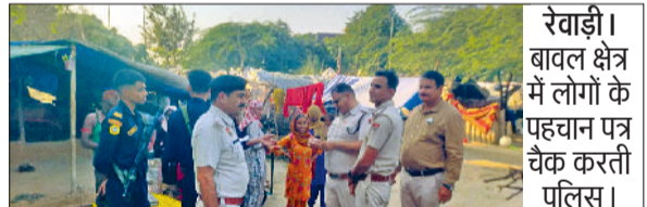
रेवाड़ी। बावल क्षेत्र में लोगों के पहचान पत्र चेक करती पुलिस।