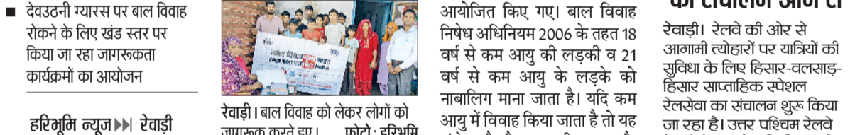
रेवाड़ी। बाल विवाह को लेकर लोगों को जागरूक करते हुए।