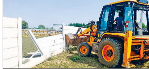
रेवाड़ी। अवैध निर्माण तोड़ती डीटीपी की जेसीबी।