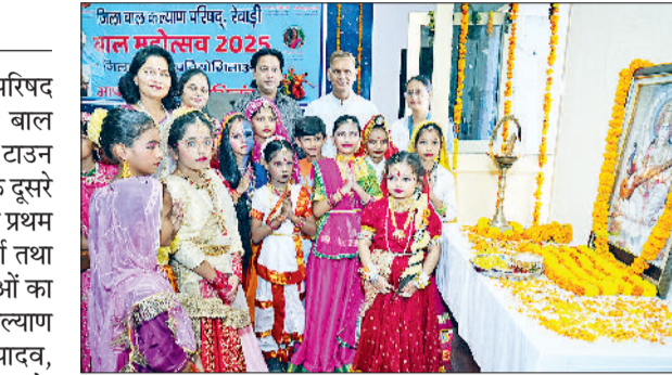
रेवाड़ी। बाल महोत्सव कार्यक्रम का शुभारंभ करते बच्चे व अधिकारी व फैसी ड्रेस प्रतियोगिता में भाग लेती छात्रा व सोलो डांस में भाग लेते हुए प्रतिभागी।

प्रतियोगिताओं में जिले के 60 विद्यालयों के बच्चों ने उत्साहपूर्वक भाग लिया। सरकारी एवं गैर सरकारी स्कूलों के बच्चों ने अपने प्रस्तुतिकरण से अद्भुत आत्मविश्वास और प्रतिभा का परिचय दिया। निर्णायक मंडल के सदस्यों ने बच्चों के प्रदर्शन की सराहना करते हुए कहा कि प्रतिभा को मंच प्रदान करना समाज की सामूहिक जिम्मेदारी है। रंग-बिरंगे परिधानों में सजकर आए बच्चों ने अपनी प्रस्तुतियों से सभी का मन मोहा। अभिभावकों और अस्थापकों ने भी बच्चों का उत्साहवर्धन किया। इस मौके पर वीरेंद्र