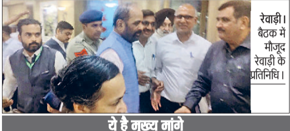
रेवाड़ी। बैठक में मौजूद रेवाड़ी के प्रतिनिधि।